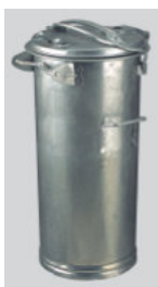
Ringtonne RTL 50