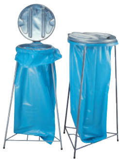
Müllsackständer MST 60 /