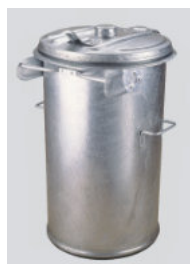
Ringtonne RTL 90